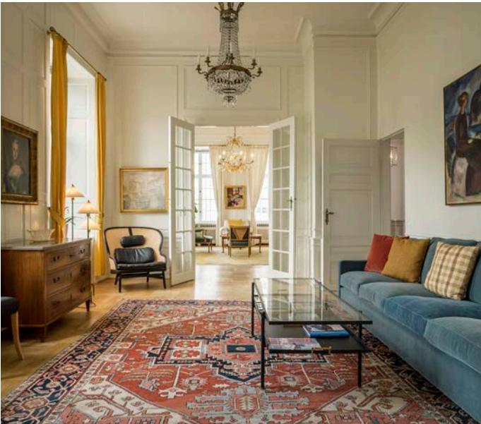
I de vackra 1700-talssalongerna blandas antik inredning med modern design.