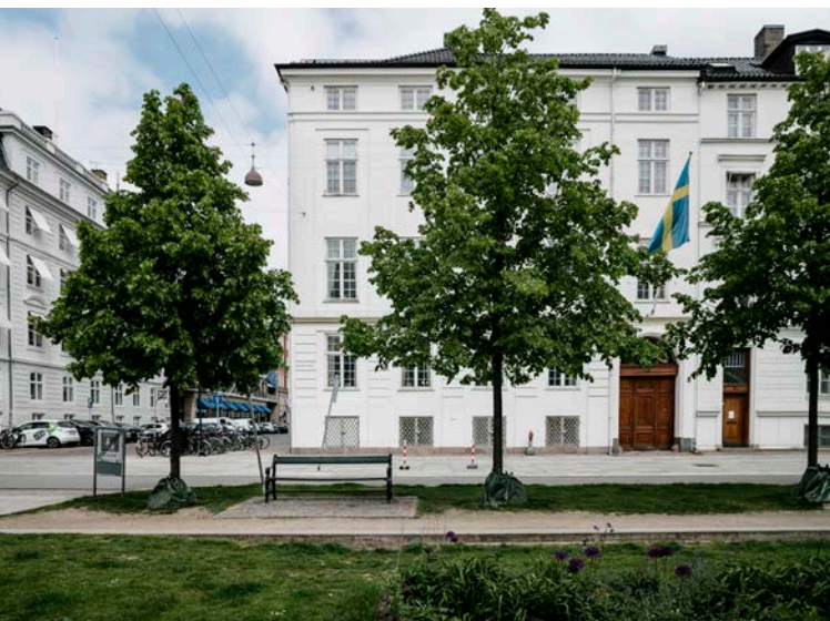
Sedan 1920-talet har Sverige huserat i hörnet Sankt Annæ Plads och Amaliegade.