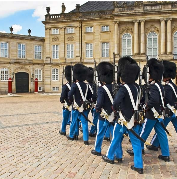
Sveriges ambassad i Köpenhamn ligger nära Amalienborgs slottsplats.