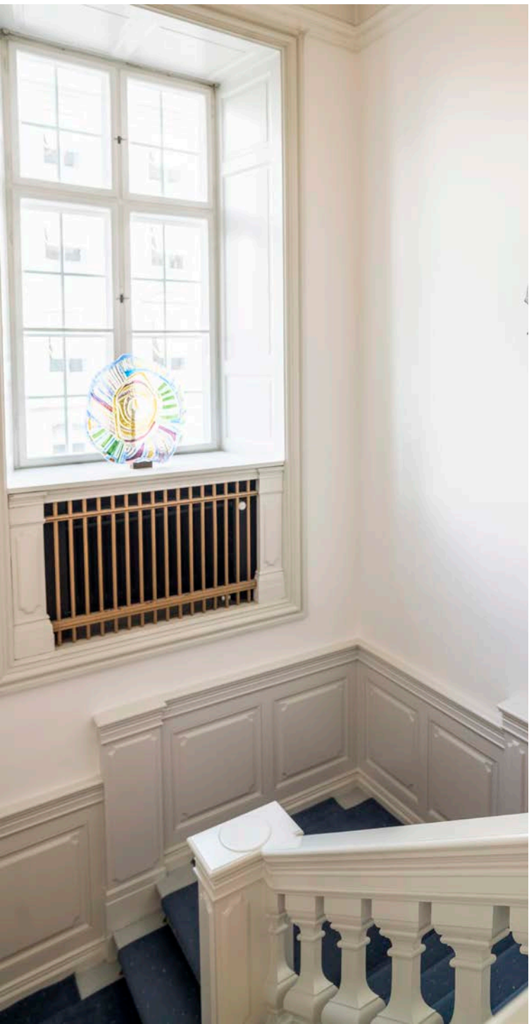
Trapphall i residenset.