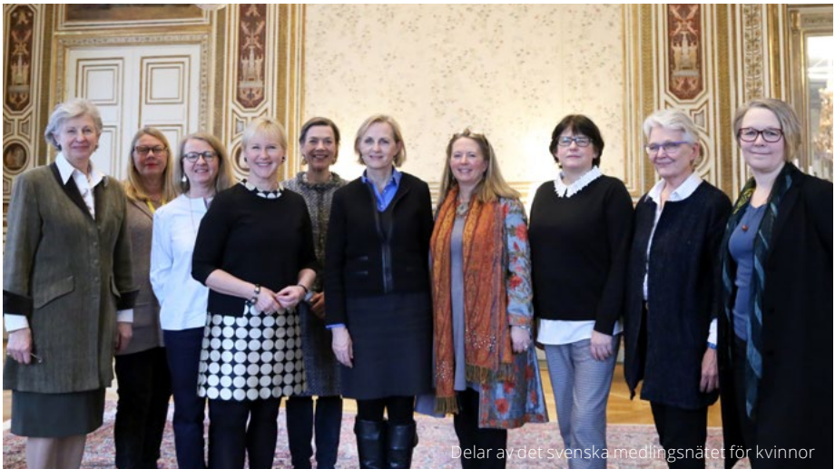
Delar av det svenska medlingsnätet för kvinnor

Det svenska medlingsnätverket initierades 2015 som ett svar på den kraftiga underrepresentationen av kvinnor i medling och fredsprocesser. Syftet med medlingsnätverket är att främja fredlig konfliktlösning och aktivt stödja kvinnors meningsfulla deltagande i fredsskapande insatser; innan, under och efter konflikt. Medlingsnätverket består av medlemmar med olika tematiska och geografiska expertkunskaper, från både civilsamhälle och utrikesdepartementet. Samtliga medlemmar är seniora kvinnor med lång erfarenhet av fredsbyggande, diplomati och politiska processer. De har hittills engagerat sig i bland annat Afghanistan, Burundi, Colombia, Georgien, Somalia, Ukraina och Zimbabwe. Insatserna har skett på olika nivåer och inkluderat strategiskt stöd till kvinnor i olika lokala samhällen liksom bidrag till fredsförhandlingar på högsta formella nivå. Det svenska medlingsnätverket är del av ett nordiskt medlarnätverk och samarbetar nära med en rad liknande initiativ, inte minst i Afrika och Medelhavsområdet, liksom med FN, EU, AU och OSSE. Medlingsnätverket är en flexibel resurs som på kort varsel kan engageras i skilda konfliktkontexter och snabbt svara på uppkomna behov. Efterfrågan är stor och nätverket har behövt utvidgas från nio till 15 medlemmar.