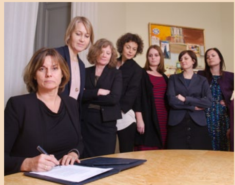
Minister för internationellt utvecklingssamarbete och klimat Isabella Lövin skriver under regeringens förslag till en ny klimatlag.